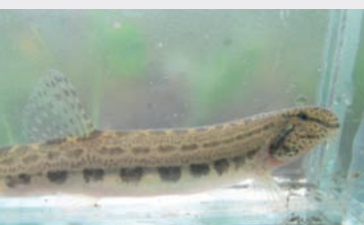
Weggevangen en verplaatste Kleine modderkruiper, februari 2008