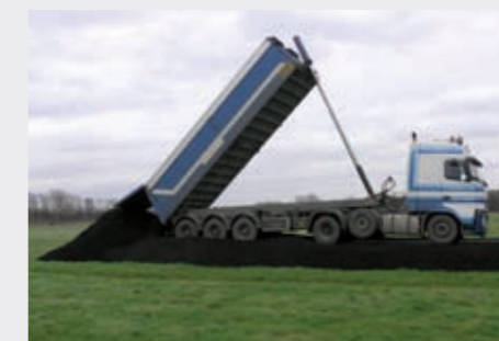
De aanleg van de tijdelijke bouwweg over het terrein nodig voor de hoeveelheid gronden