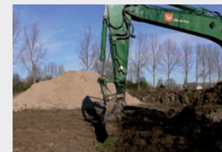
Het schoonmaken van de sloot voordat deze wordt dichtgegooid